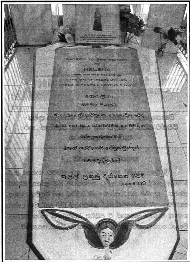
එතුමියගේ ශ්‍රී ශරීරය තැන්පත් කර ඇති ස්ථානය වසා ඇති සමරු එළකය