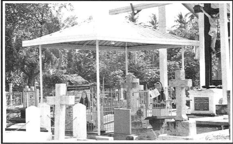
ගෝනාවිල දෙව් මැදුර ඉදිරිපිට සුසාන තුමියේ ගරු හෙලේනා තුමිය මිහිදුන් කර ඇති ස්ථානය