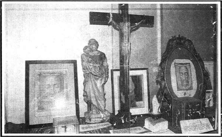
එතුමිය පිවත්ව සිටිය දී භාවිත කළ ඉද්දවූ භාණ්ඩ