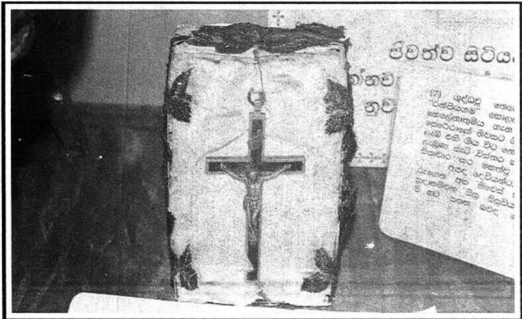
එතුමිය පිවත්ව සිටිය දී පරිහරණය කළ ඉද්දවූ කුරසිය