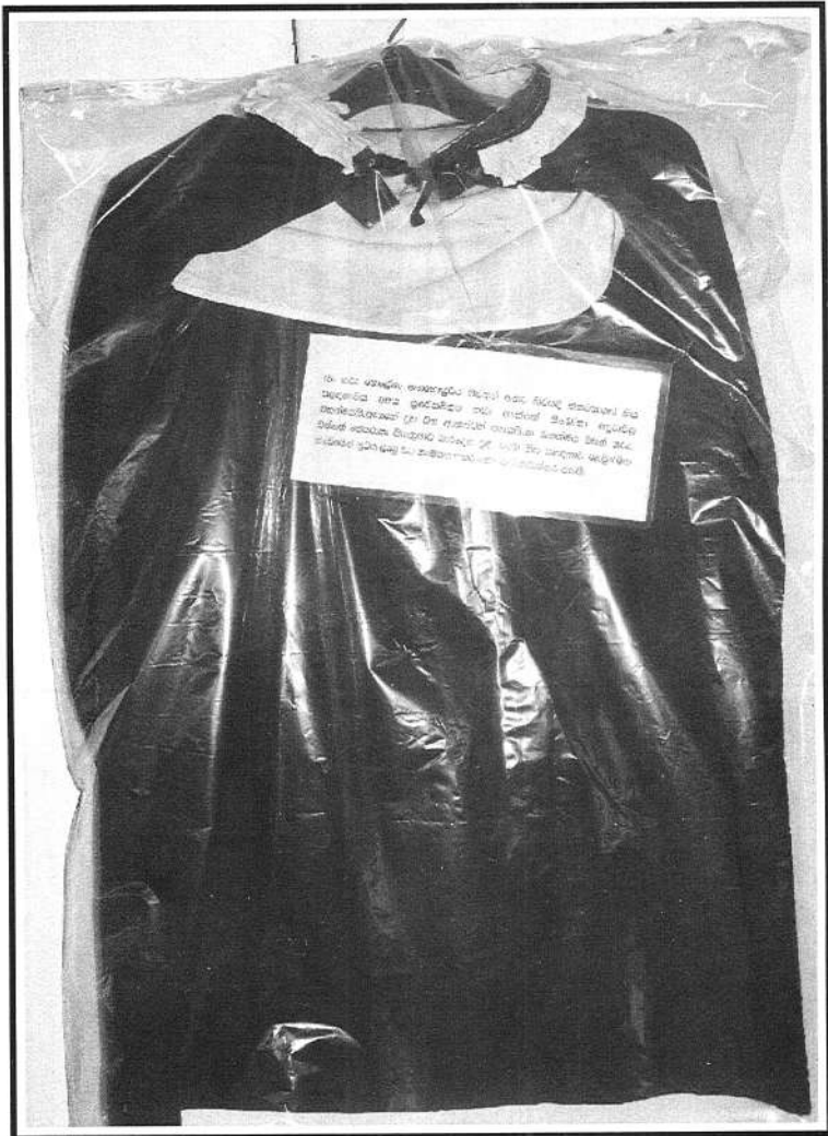
ගෝනාවල ගරු හෙලේනා තුමිය පිවත්ව සිටිය දී හාවිත කළ හිස පළඳුනාව